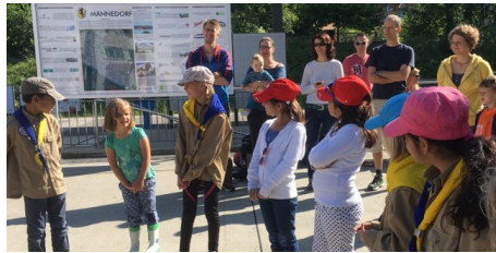
Auf ins Pfadilager!