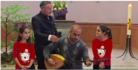
Musikalischer Vortrag mit syrischen Klängen und Liedern während des Flüchtlings-Gottesdienstes