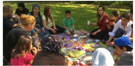
Gemütliches Beisammensein mit exquisiten Speisen aus Syrien, dem Iran und Afghanistan

Möchten Sie sich einmal an einem Projekt beteiligen oder schnuppern kommen, dann kontaktieren Sie uns mittels Kontaktformular auf unserer Homepage.