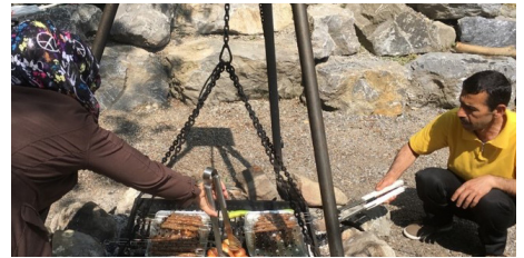
Spontaner Grillnachmittag bei der Pfadihütte Falkenburg