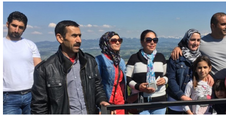
Erstbesteigung des Hochwacht-Turms auf dem Pfannenstiel