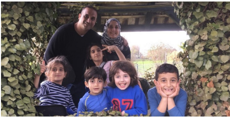
Spaziergang in der Wohngemeinde mit Erkundung der Umgebung

Unsere Homepage informiert ausführlich und aktuell über alle Aktivitäten und Projekte. Die folgenden Fotos zeigen dazu einige Highlights.